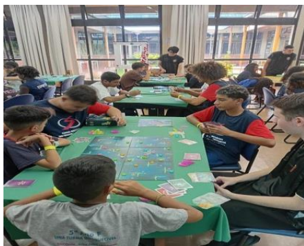
Figura 4: Campeonato de jogos na Unesp dia 07/11/25