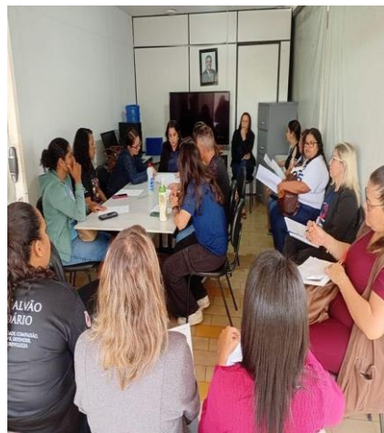
Figura 2: Reunião no CMAS dia 04/11/25