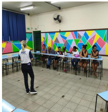
Figura 4: Reunião de pais e ou responsáveis dia 19/11/2025

OBJETIVO ESPECÍFICO: de qualificar a oferta do serviço por meio da promoção da capacitação sistemática dos profissionais responsáveis pela execução do serviço.