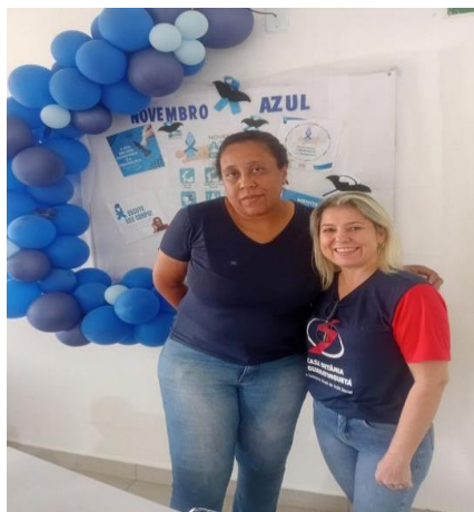
Figura 1: Articulando com a enfermeira da COHAB Bandeirantes dia 18/11/2025