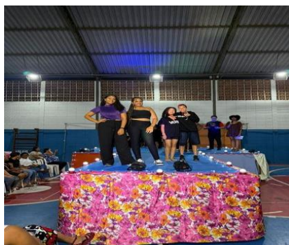
Figura 5: Desfile Dandara dia 18/11/25