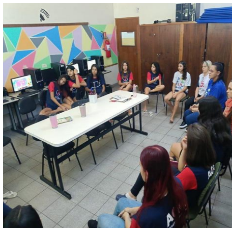
Figura 2: Oficina de Educação Humana com as adolescentes dia 27/11/2025